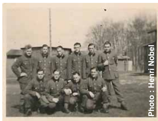
Le groupe des «Malgré nous» alsaciens du Groupement de réserve et d'instruction 65 d'artillerie lourde Batterie (Schw.Artl. Ers.u.Ausb.Abt 65)