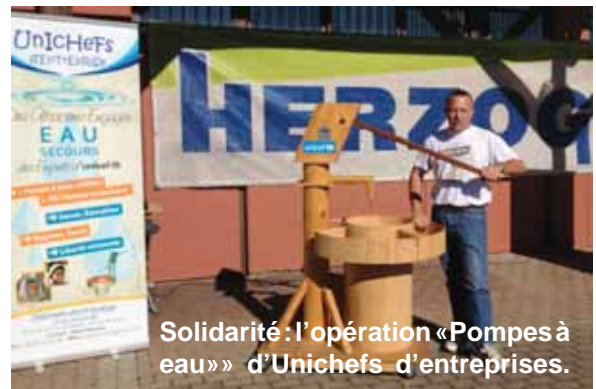
Solidarité: l'opération «Pompes à eau» d'Unichefs d'entreprises.

Une épreuve exceptionnelle, seule épreuve internationale en Europe ce jour là et située non loin des Championnats de France. Elle réunira les meilleurs spécialistes de cyclo-cross ... et peut être quelques surprises !