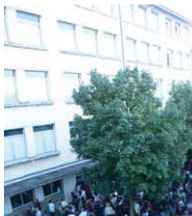
Projet de rénovation et de mise aux normes de l'école Cassin,

Les élus de la majorité municipale, Réussir Ensemble Lutterbach