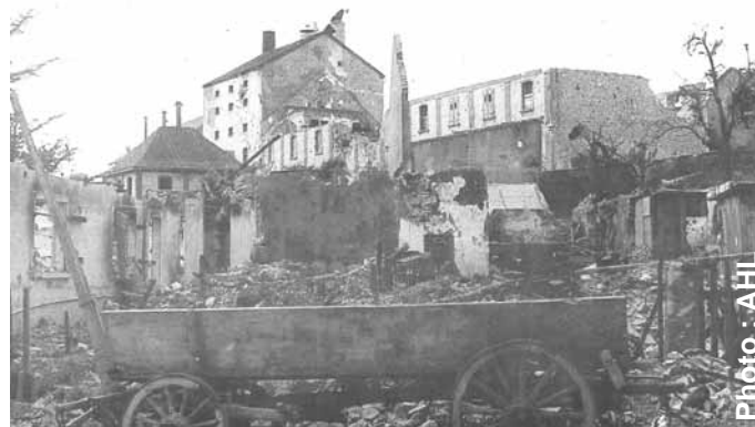
Les ruines de la Brasserie à la libération. Au premier plan ce qu'il reste de la ferme Schwebellen.

Célébrations du 70e anniversaire de la libération.